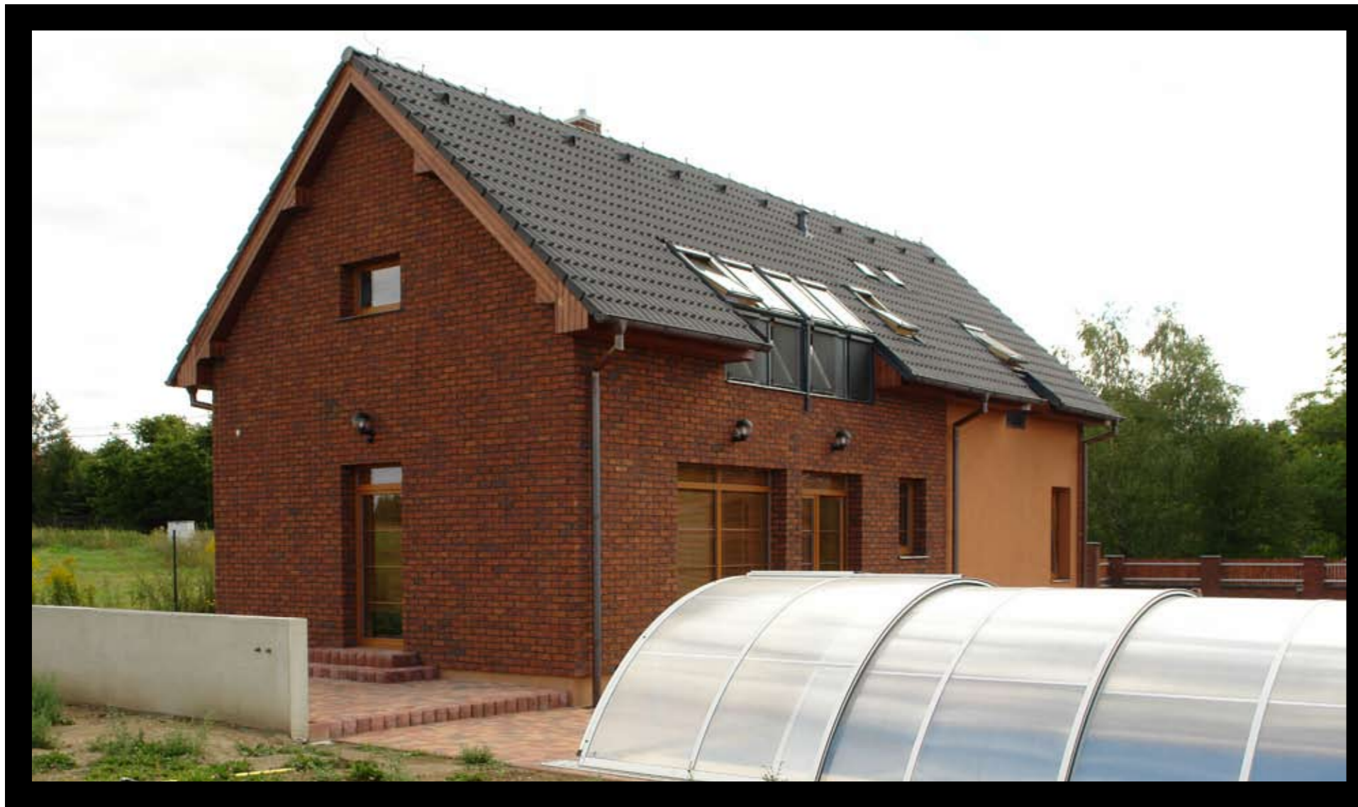
Jednoduchou hmotu domu oživuje barevná omítka a obložení fasády cihelnými pásky. Zajímavým prvkem je sestava čtyř střešních oken

TYPOVÝ DŮM APOLLO Z NABÍDKY 800 PROJEKTOVÝCH ŘEŠENÍ SPOLEČNOSTI G SERVIS CZ SI MANŽELÉ SE DVĚMA DOSPĚLÝMI DĚTMI VYBRALI MIMO JINÉ PRO JEHO ÚČELNOST A JEDNODUCHOST. KDYŽ SE MODERNÍ FUNKČNÍ USPOŘADÁNÍ SPOJÍ S BOHATSTVÍM SVĚTLA, VZNIKNE PŘÍJEMNÝ ÚTULNÝ DOMOV.